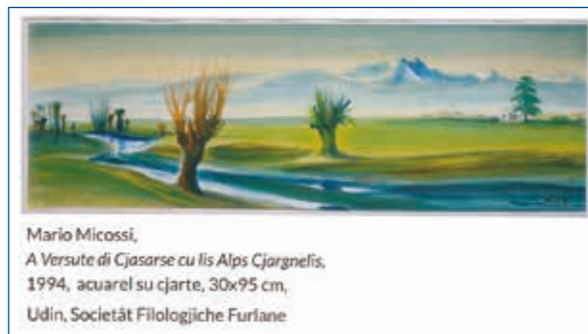
Mario Micossi, A Versute di Cjasarse cu lis Alps Cjargnelis , 1994, acquarel su cjarte, 30x95 cm, Udin, Societât Filologjiche Furlane

«La propueste di un viaç ta l'art in Friûl – al rileve Gotart Mitri tal so intervent – e va propit ta la direzion dal recupar da la memorie storiche e culturâl di une comunitât che e intint di vivi. Un popul cence memorie, al diseve Confucio, nol à storie». Paolo Pastres, tal so Incjant da l'art in Friûl , al vise che «il studi da la storie da l'art nol è dome une maniere par scuvierzi e recuperâ parts significativis dal passât, ma al à ancje un profont valôr civîl, sedi ta la sensibilizazion e la conservazion dal patrimoni che nus è stât dât in custodie, sedi par onorâ un debit di ricognos-