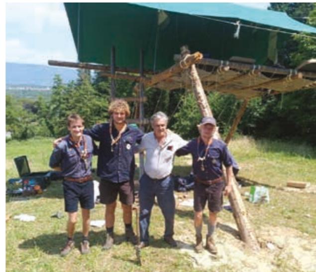
■ Villa Gallici Deciani e alcuni partecipanti al campo base davanti a una delle piattaforme realizzate