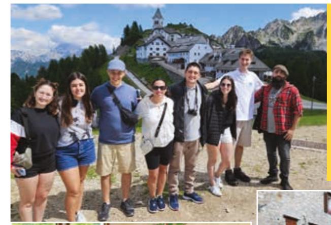
■ Sopra, la visita ad Aquileia e, qui a sinistra, quella sul Monte Lussari. Sotto, le visite a Cavasso Nuovo e a Poffabro e, in fondo, alla sede della Fondazione Carigo

Venerdì 23 giugno, al loro arrivo, i giovani hanno avuto l'occasione irripetibile di vivere nella splendida cornice della Fondazione Villa Russiz , a Capriva , l'anteprima della Convention Annuale dell'Ente Friuli nel Mondo, seguita l'indomani a Udine dalla storica celebrazione per il 70° compleanno, ospitata nel prezioso Salone del Parlamento del Castello. Da lunedì 26 a venerdì 30 giugno si sono susseguite le tappe e gli incontri calendarizzati, che hanno spaziato su tutto il territorio regionale: a Udine le visite allo Stadio Friuli , alla sede dell' Udinese calcio , alla Società Filologica Friulana , e al Museo del Duomo . All'innovativo Smart Space della Fondazione Carigo , a Gorizia, seguita dalla scoperta della città attraverso il percorso di Isonzo Xr Sasaki . A seguire, sotto la regia di Con-