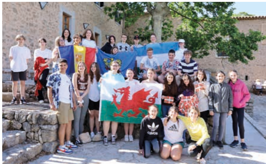
I zovins che a àn partecipât al campus ECCA

I students (tra i 14 e 17 agns) des vot regions linguisticis, graciis ae poie dai partners dal progjet ECCA, e fra chei la ARLeF - Agenzie regionâl pe lenghe furlane, a àn podût cussì celebrâ lis lôr lenghis e vivi esperiencis che a puartaran simpri