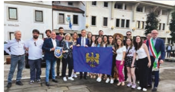
Alcuni momenti dei percorsi formativi e delle visite al territorio da parte dei dodici laureati provenienti dal Sudamerica, discendenti di emigrati friulani