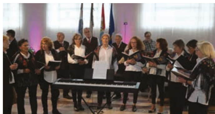
■ A sinistra, foto di gruppo per il Centro Friulano di Santa Fe. Qui sopra, il coro. In alto, il paiolo con la polenta

È una festa che scalda i cuori, unendo i friulani (e non solo i friulani) di Santa Fe . Si tratta della Sagra della polenta friulana , che si celebra ogni anno a luglio, per ricordare l'anniversario della nascita del Centro Friulano . Fondato nel 1951 dagli immigrati friulani della città e della regione, in cerca di una casa comune che desse stabilità ai loro primi incontri, il Centro Friulano è ancora il luogo dove si rivive la nostalgia e l'amore per il Friuli, tra i discendenti di quegli immigrati.