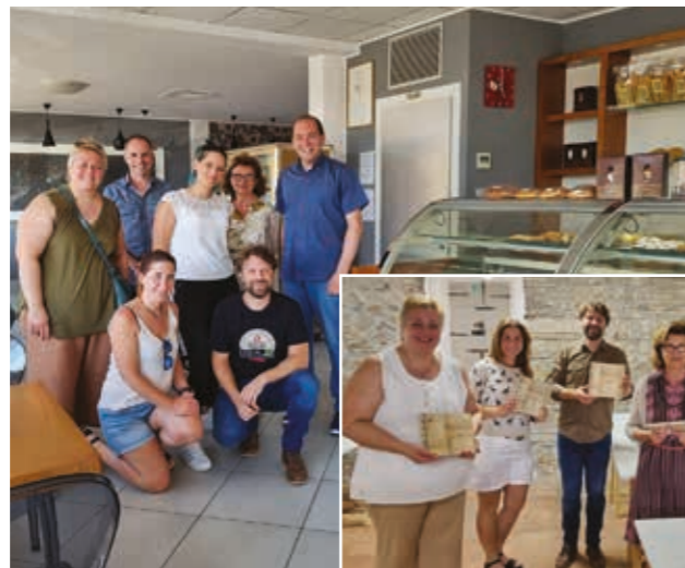
■ Sopra, foto di gruppo alla presentazione del progetto. Qui a lato e sotto, due momenti degli workshop

e Spazio 35 (Udine); Cioccolateria di Adelia Di Fant e Prosciuttificio Bagatto (San Daniele); due botteghe artigiane di Venzone; Dorbòlò Gubane e Julia Marmi (Cividale); Blifase e Birrificio Campestre (Corno di Rosazzo); Pasticceria Charlotte (San Giovanni al Natisone). Tutte queste realtà artigiane di eccellenza hanno potuto trovare nei cinque corregionali e, in proiezione, nei rispettivi Fogolàrs, nuovi testimonial e portavoce, ambasciatori non solo delle tradizioni e della cultura friulana, ma anche dell'economia locale.