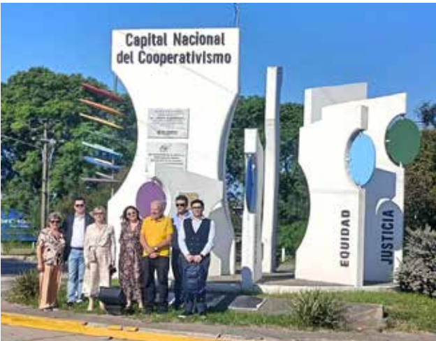
Frente al Monumento al Cooperativismo.