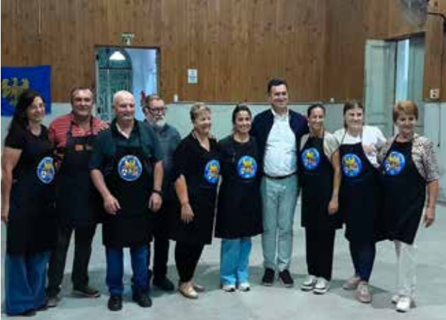
Cena de Bienvenida en la Sociedad Italiana de Sunchales.

El lunes 10 y martes 11 de marzo, recibimos la visita de una delegación Friulana.