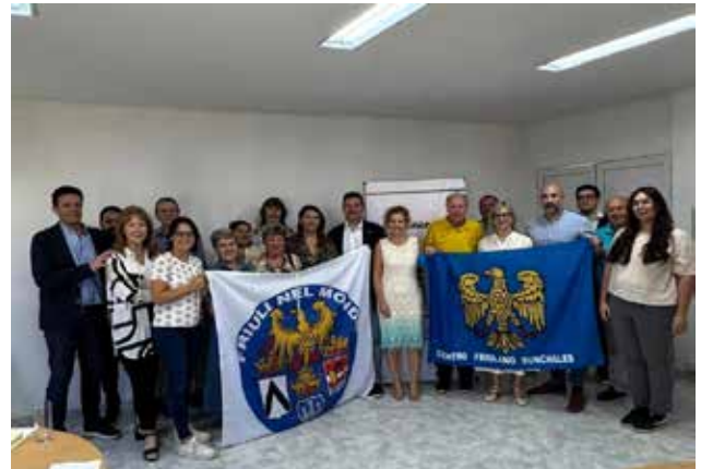
Encuentro con industriales y emprendedores.