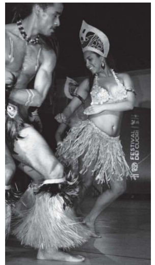
Le danze dell'Isola di Pasqua, al Festival dei Cuori del 2019.

Per sapere chi sono, basta scorrere le pagine dei giornali o consultare i siti delle Pro Loco. Noi nello scorso numero abbia-