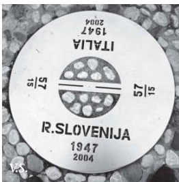
La lastra di metallo che segna il confine Italia-Slovenia.

sa regnante dei Borbone di Francia. Riusciamo però a compiere una breve visita al santuario, prima di concederci un lauto pranzo in un ristorante di Nova Gorica.