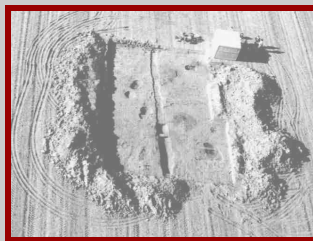
F.to Sito Preistorico della Pianura Friulana