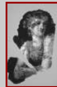
F.to Affresco Romano Torre di PN