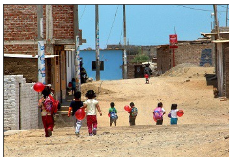
Tanja Di Piano Germogli nella polvere, 2015