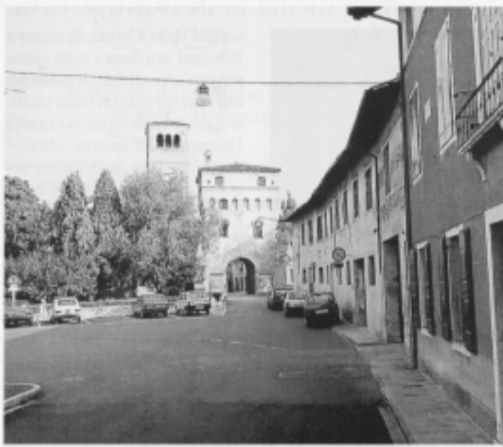
*Sorge in pieno centro storico, in area adiacente alla storica abbazia...

Del complesso fanno parte il palazzo padronale, varie pertinenze e un grande parco: in tutto ciò l'Amministrazione comunale