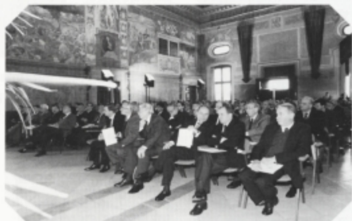
Udine, Castello: nel Salone del più antico parlamento d'Europa erano presenti autorità cittadine, regionali e rappresentanti delle più importanti associazioni bancarie italiane.