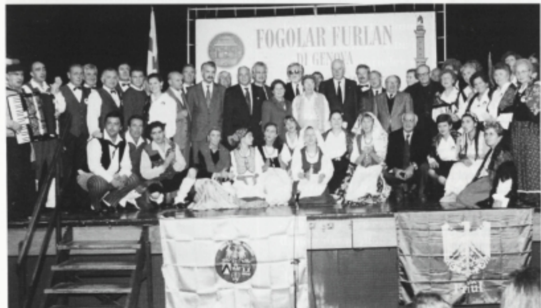
Gran finale, con protagonisti, autorità, presidenti e rappresentanti di Fogolâr sul palco. I vent'anni del Fogolâr di Genova non saranno facilmente dimenticati.