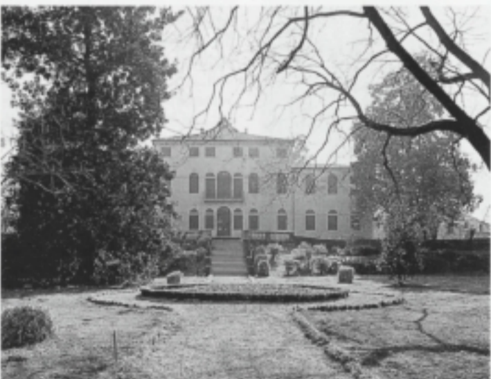
Brugnera: Villa Varda a San Cassiano.

con ampio parco e trova la propria origine con la comparsa a San Cassiano dei nobili Mazzoleni nel Cinquecento. Da allora, per vari motivi, sia economici che ereditari, il complesso passò attraverso vari proprietari, finché nel 1870 esso venne acquistato dai nobili triestini Morpurgo de Nilma. Nei primi decenni di questo secolo i Morpurgo provvidero ad ampliare e am-