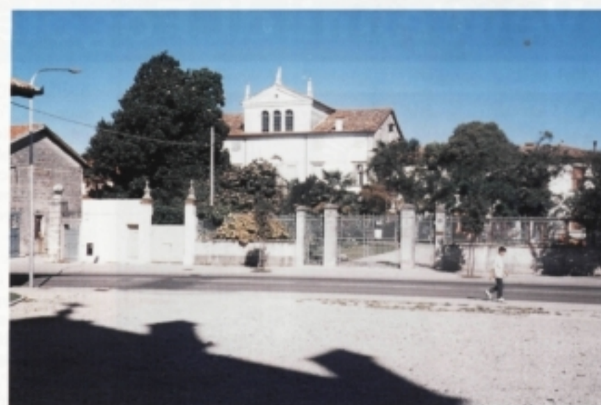
Savorgnano: Palazzo «Renzi» e l'«Asilo», visti dal piazzale della chiesa di San Giacomo.