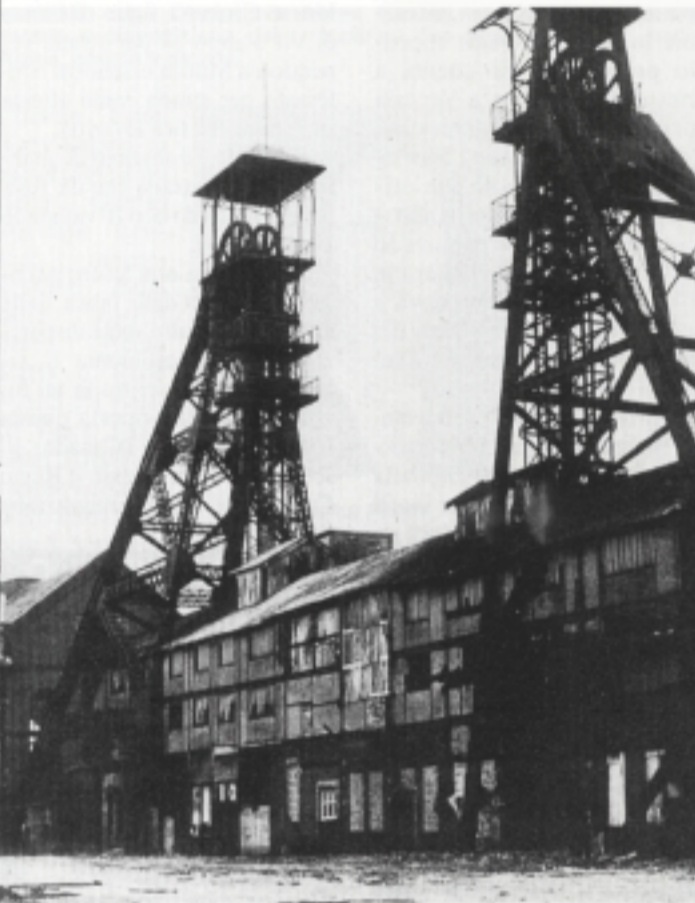
Nel 1956, di fronte all'aggravarsi della situazione occupazionale interna, l'Italia ripristinò l'autorizzazione di continuare il reclutamento, da parte del Belgio, di lavoratori italiani per le sue miniere. Crudele ironia della sorte, l'8 agosto dello stesso anno si verificò la terribile catastrofe del pozzo Saint Charles, della miniera del Bois du Cazier, a Marcinelle: a 975 metri di profondità, ci furono 262 morti, tra cui 136 italiani. Una tragedia che lasciò 204 vedove e 417 orfani.

logiche mercantili risulta dagli incontri successivi tra i rappresentanti dei due governi. Per esempio, al termine di una sessione di lavoro svoltasi a Roma dal 15 al 26 ottobre, i contraenti fissarono anche il prezzo del carbone belga, tenendo conto del grande vantaggio rappresentato, per il Belgio, dell'invio di lavoratori da parte dell'Italia. Si trattò anche del trasferimento dei risparmi che i minatori inviavano alle loro famiglie. Questi si lamentavano sia dei tempi esageratamente lunghi per l'arrivo a destinazione delle somme inviate, che del cambio ufficiale troppo basso che il Ministero italiano delle Finanze applicava ai loro invii. Oltre alla beffa, anche l'inganno!