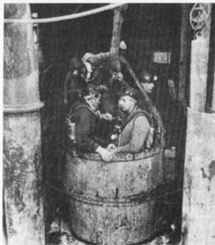
Il «Ciuffat», più leggero e maneggevole, è sempre stato utilizzato nelle catastofie minerarie. Qui sopra, soccorritori pronti alla discesa a Marcinelle, 1956.