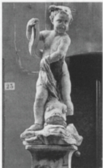
Fontana con «putto» (particolare).

convenuti si sono trasferiti presso il ristorante panoramico «Montallegro», posto sulla parte alta della città, dove si è svolto il classico «gustà in companie».