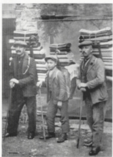
Cramârs di Vinalo in una foto del 1930.