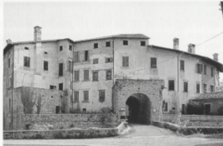
Valvasone: il Castello.

scovi di Concordia, che rivendicavano la reliquia, i conti Di Valvason ottennero dal Papa il diritto di conservare a Valvasone la tovaglia miracolosa purché adeguatamente custodita in una chiesa eretta allo scopo.