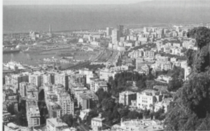
Genova: Panorama della città.