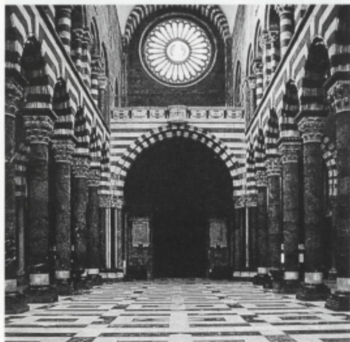
Duomo di S. Lorenzo, interno.