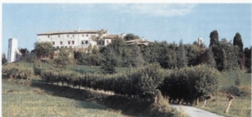
Rive d'Arcano: Il Castello.