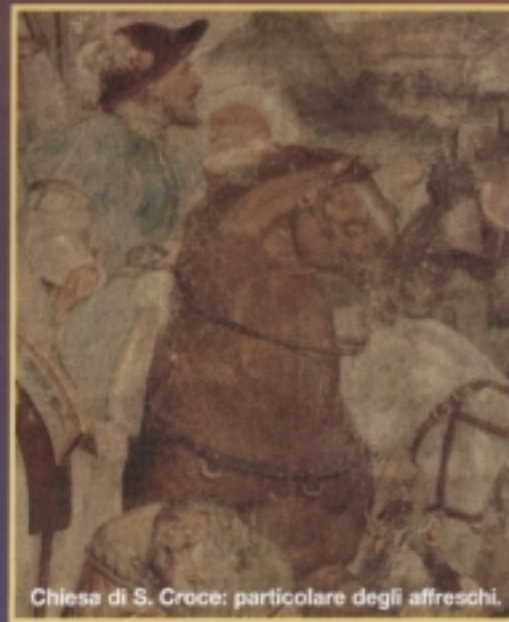
Chiesa di S. Croce: particolare degli affreschi.