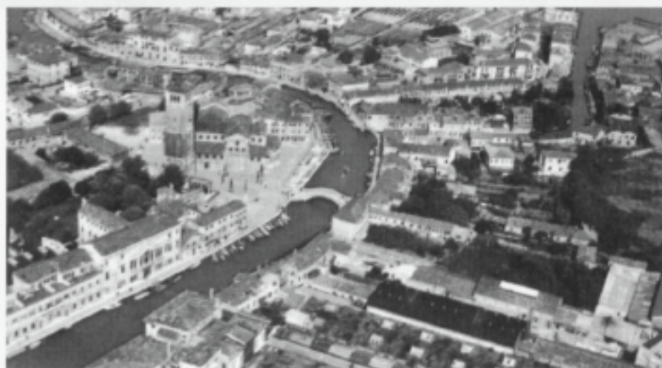
«In genere i tesani amavano il lavoro stagionale nelle vetrerie di Murano o quello di scaricatori di porto a Trieste...». (A sinistra, veduta di Murano / autoriz. 145-73 SMA; a destra, il Porto di Trieste).

Le donne quali compiti avevano al paese? Innanzitutto quello di tener salda la famiglia in assenza dei mariti; tener in piedi la casa, le piccole proprietà col lavoro dei terreni in attesa degli uomini i quali pensavano ai lavori più pesanti dell'estate. Davano l'educazione ai figli e vivevano i mille problemi della fami-