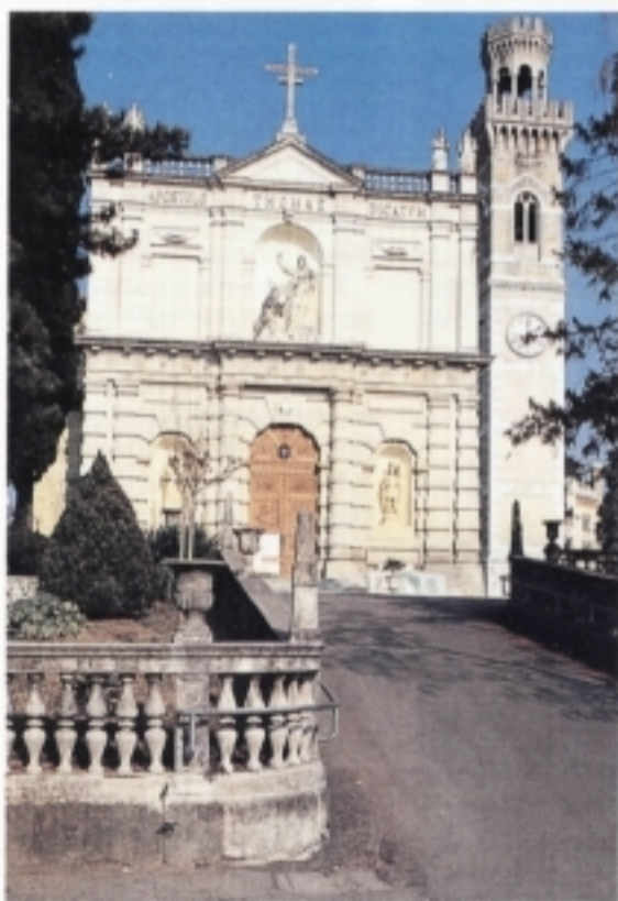
Caneva: La Chiesa parrocchiale dalla singolare facciata.

■ ■ SAN VITO AL TAGLIAMEN- TO - Savorgnano chiede più attenzione - A Savorgnano, come ai vecchi tempi, giovani e anziani, presidenti e soci delle diverse associazioni che operano nel paese, si sono dati convegno per una serata dove poter scambiare un'opinione sui problemi cittadini della frazione. Stipati in un'aula delle ex scuole elementari,