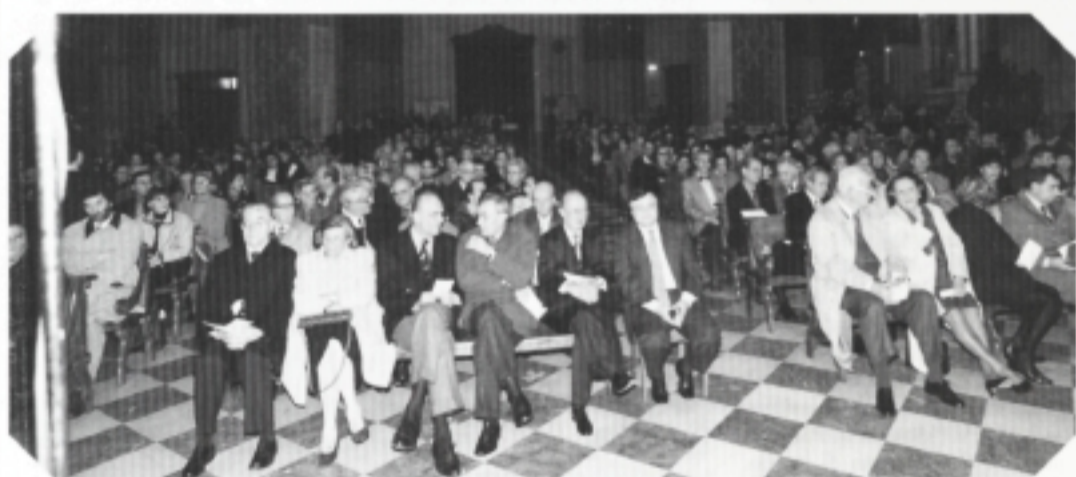
Un particolare del numeroso pubblico intervenuto al concerto.

Con un concerto serale nel Duomo di Udine che ha visto una grande partecipazione di pubblico, si sono aperte venerdì 15 novembre le celebrazioni promosse dalla Fondazione Cassa di Risparmio di Udine e Pordenone e dalla CRUP spa per ricordare i cinquecento anni del Monte di Pietà di Udine e i centoventi anni di attività della Cassa di Risparmio.