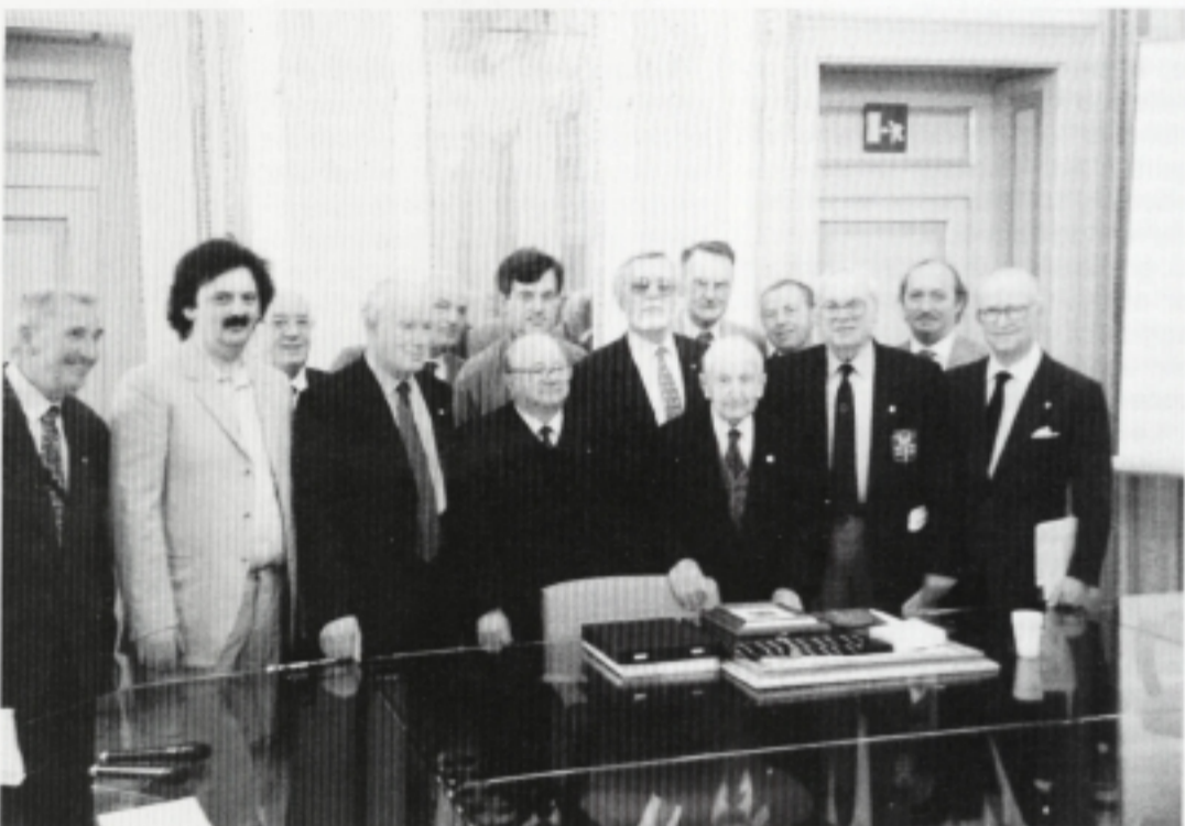
La foto che pubblichiamo in calce alla lettera del prof. Desio, è stata scattata dall'obiettivo di Friuli nel Mondo sabato 31 maggio, a Milano, presso la prestigiosa Sala Napoleonica dell'Università Statale, dove il Fogolâr di Milano, unitamente a Friuli nel Mondo e al Coordinamento Fogolârs della Lombardia, ha reso pubblico omaggio all'illustre scienziato. Sono con lui, terzo da destra in primo piano, vari presidenti di Fogolârs, e, primo sulla sinistra, il noto alpinista friulano Cirillo Floreanini, che fece parte nel 1954 della celebre conquista del K2.