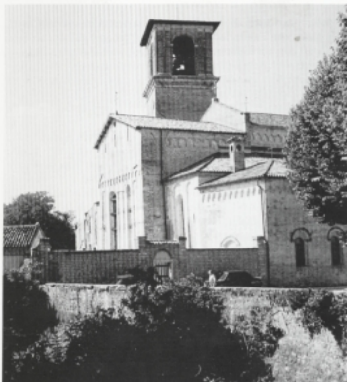
Un bel particolare del Duomo.

omaggio floreale. È seguito il pranzo comunitario durante il quale il sindaco Gerussi ha portato il saluto della città, proponendo l'annuale incontro degli emigranti organizzato dall'Ente Friuli nel Mondo, per il quale a nome del