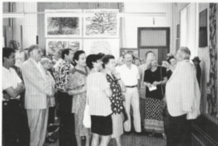
Un altro momento dell'interessante visita effettuata alla Scuola di Mosaico di Spilimbergo.