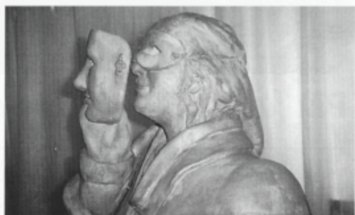
Cordelia von den Steinen: terracotta, 1996.