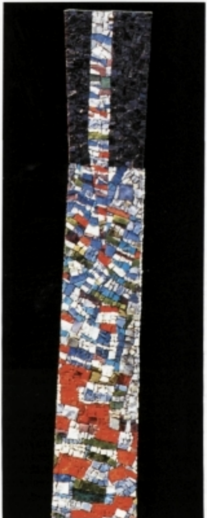
Giulio Candussio. «Strutture iridescenti». Tecnica diretta su supporto aeroflam. Smalti, paste vitree, ciottoli, materiali naturali e ceramici. Cm. 30x150. 3° Corso.

Da Pasadena (USA) è passato per caso per la Scuola di Spilimbergo, rimanendone affascinato, il giovane artista Michael Osborne. Ne è nata una collaborazione che ha portato alla realizzazione (guidata dal maestro Rino Pastortutti) di dieci pannelli in cui «la tessitura musiva, per lo più nei toni caldi dei materiali naturali, imprime al segno una vi-