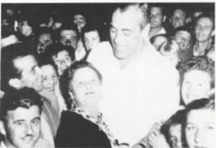
Il debutto pubblico del Fogolâr di Adelaide avvenne nel gennaio del 1959, con una grande festa popolare alla quale intervenne come ospite d'eccezione Primo Carnera.