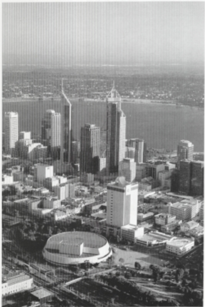
«Perth è una città ariosa e luminosa...».

taceli e i grandi supermarkets, Perth esibisce una modernità non stucchevole: anzi, siccome oggi va di moda la montatura moderna per gli oggetti antichi, si può ben immaginare la modernità quale idonea corni-