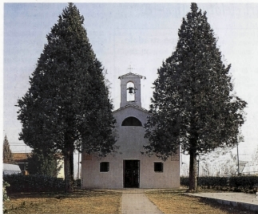
Fiume Veneto: l'antica Chiesetta della Madonna della Tavella.