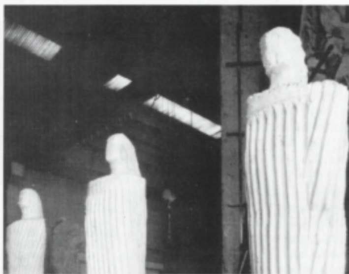
Ivo Soldini: opere in gesso, 1997.

Poi vennero «i polez e i lusòrs» di Eugenio. Ma era tuttavia una sagra che si svolgeva nell'ambito paesano intorno al