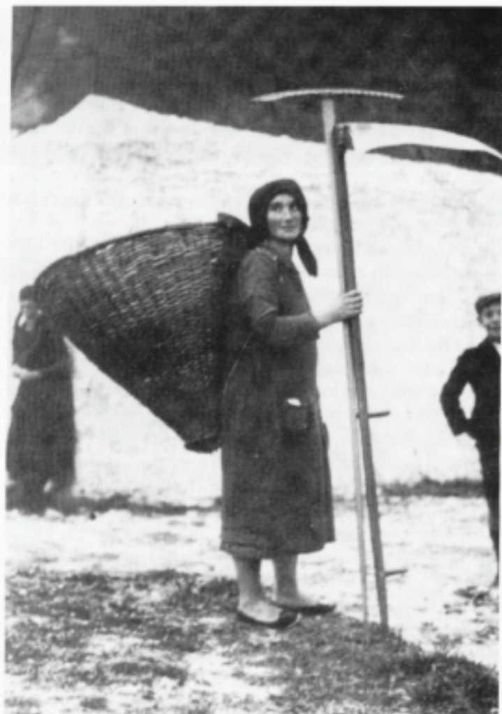
Donna con gerla sulle spalle. 2.10.1929.