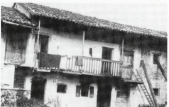
Tramonti di Sotto. Casa rustica. 2.10.1929.

futuro non può prescindere dalle conoscenze sul passato: cosa che «Lis Vilis di Tramonc'» contribuisce egregiamente a fare.