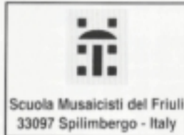
Scuola Musicaisti del Friuli 33097 Spilimbergo - Italy