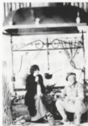
Adelaide: si ricorda il Friuli... «sot la nape dal fogolâr».