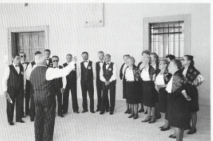
Il Coro del Fogolâr di Milano esegue, sotto la loggia del municipio di Spilimbergo, le più belle villotte del proprio repertorio.