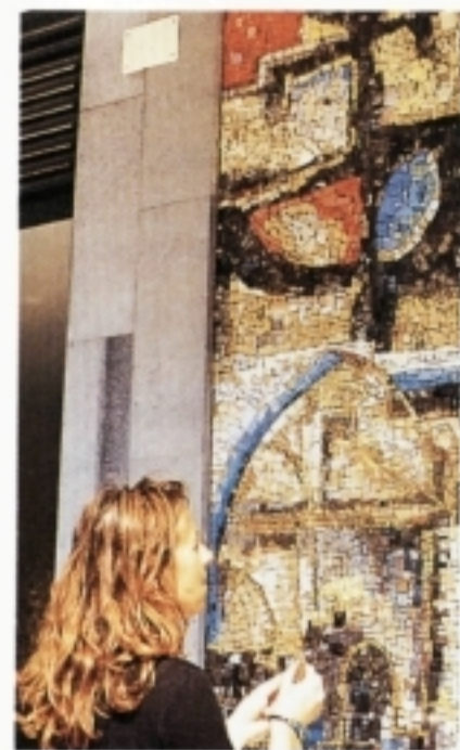
Gianni Dova, installazione a Udine. 3° Corso.