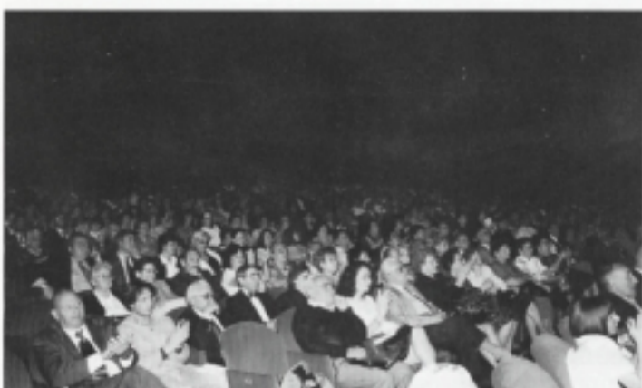
Il pubblico presente alla serata.