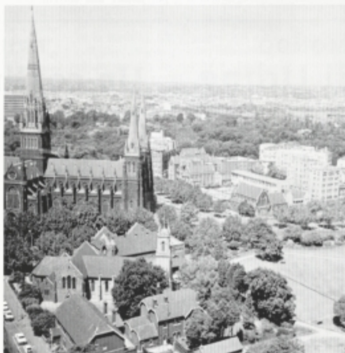
«Considerata città della cultura, Melbourne è una specie di Firenze...».

Già tifoso della Juventus torinese, ha da tempo nel cuore i bianconeri della Juve australiana e ha pubblicato perfino un libro dal titolo «Juve! Juve!» per celebrarne la storia e le glorie. Me ne ha regalato un esemplare con dedica, e io lo ringrazio. Però, pur non essendone mai stato un tifoso, gli faccio ora presente che quest'anno l'Udinese ha battuto la Juventus di Torino per 4 a 0 e ha ottenuto altri successi clamorosi. Allora lui - che è un buon friulano - ora dovrebbe