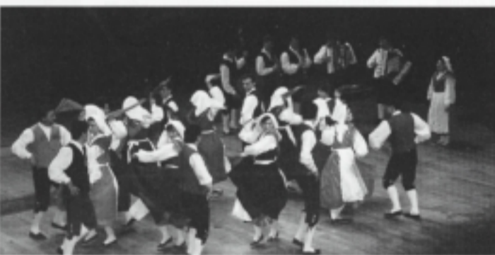
Latina, 17 maggio 1997: un momento dell'applauditissima esibizione del Gruppo Folcloristico «Pasian di Prato».

Dopo una breve visita alla sede del «Fogolar Furlan» il sodal-