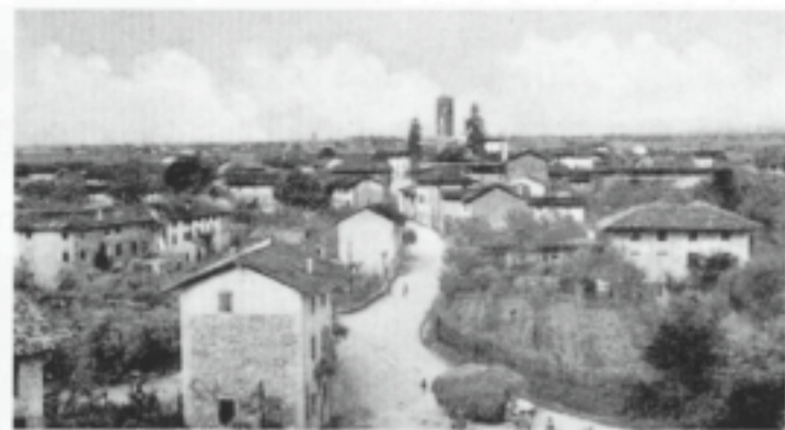
Povoletto: panorama e via Roma in una vecchia immagine risalente al 1944.