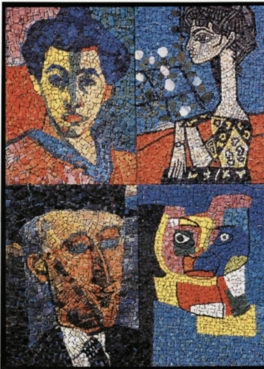
Traduzione musiva di un volto d'autore del '900. Tecnica diretta su rete. 3° Corso.