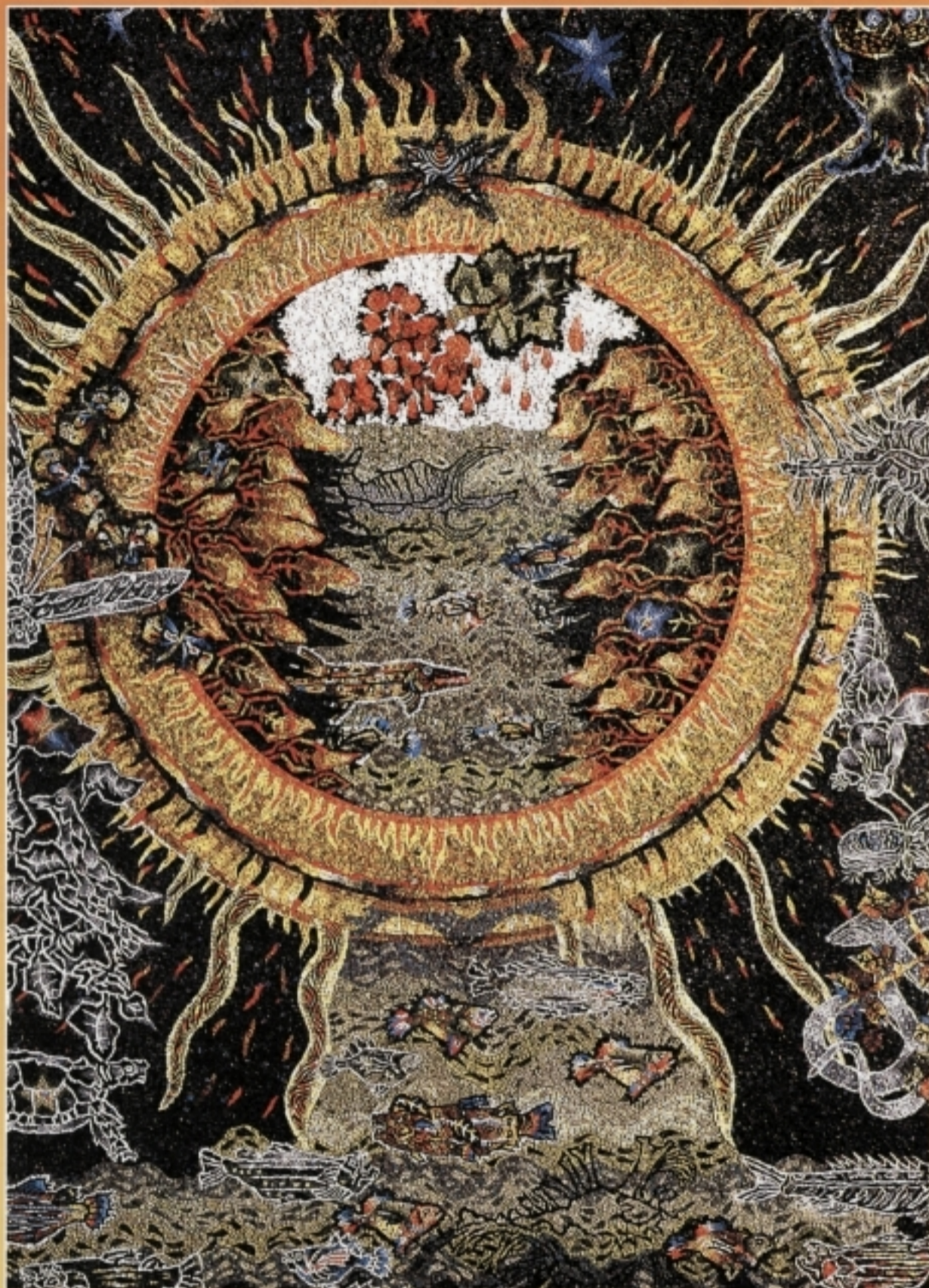
LA SCUELE DI MOSAIC DI SPILIMBERC

La diaspora friulana può e deve essere considerata un vero e proprio avamposto per la diffusione dell'immagine complessiva della terra di origine presso la comunità internazionale. Per non rischiare di disperdere questo immenso capitale ma integrarne le potenzialità in un progetto organico di sviluppo del Friuli, è urgente e necessario ricostruire, su nuove basi, un rapporto organico tra diaspora e società friulana, seriamente compromesso nell'ultimo periodo.