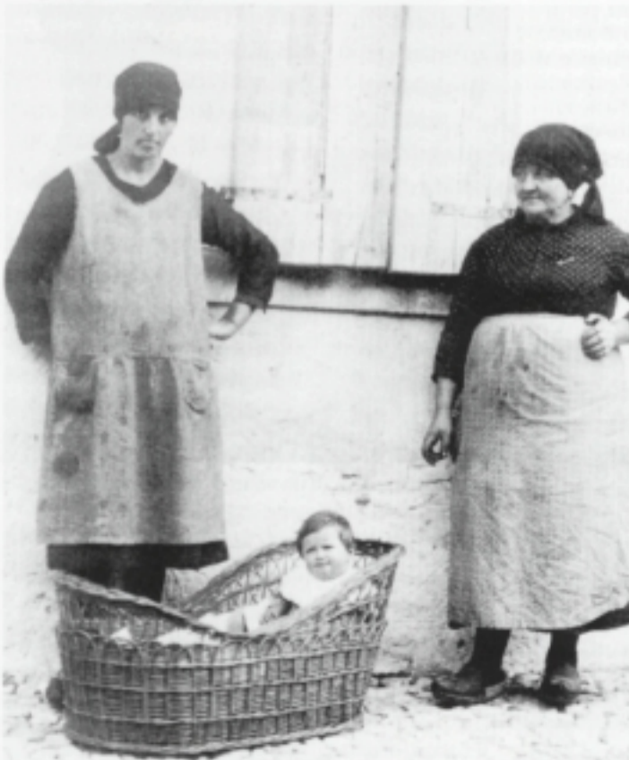
Tramonti di Sotto. Cuna e donne (queste cune si fanno a Tramonti di Mezzo). 3.10.1929.