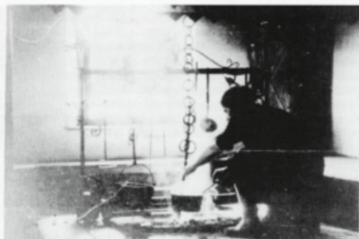
Preparazione della polenta.