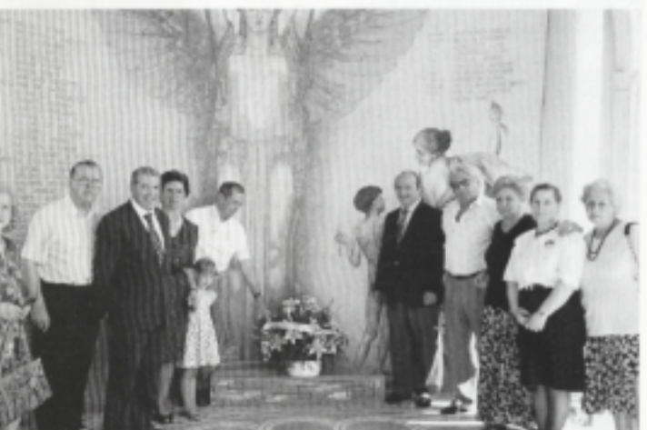
Una rappresentanza dei Fogolârs della Lombardia depone un omaggio floreale al Monumento ai Caduti.