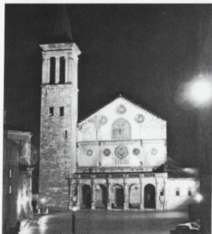
Spoleto: veduta notturna del duomo.