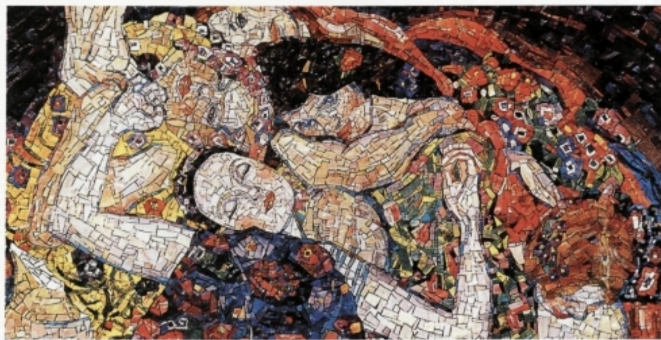
Gustav Klimt, particolare de «La Vergine», 1913. Tecnica diretta su rete. 2° Corso.

Una volta chiarita la natura e la funzione della Scuola, non resta che soffermarsi sulla mostra, che è accompagnata da un interessante catalogo edito per l'occasione. La rassegna raccoglie i lavori eseguiti (nell'anno scolastico 96-97) dagli allievi e dai loro maestri, secondo un metodo didattico che consiste nell'affrontare la tecnica esecutiva seguendo le fasi storiche dell'evoluzione musiva, iniziando, nel primo corso, a riprodurre le copie di mosaici antichi, per arrivare alle sperimentazioni più avanzate dell'ultimo corso. Perché il mosaico si evolve: dopo gli splendori dell'antichità (periodi romano e bizantino) l'arte musiva ha conosciuto la decadenza del periodo rinascimentale, quando venne ridotto a mera funzione decorativa. Per fortuna nell'età moderna - come bene mette in evidenza Chiara Tavella nel suo saggio - molti artisti (da Severini in poi) si sono posti il problema dell'unità più completa possibile fra artista che diseg-