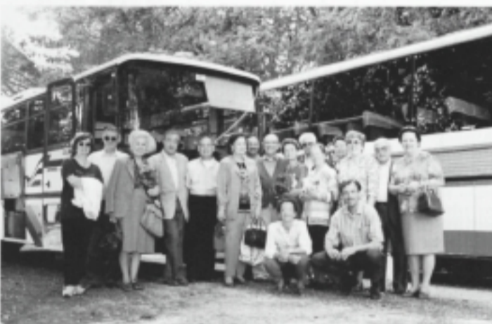
Parco del Circeo: dirigenti e rappresentanti dei Fogolar di Latina, Aprilia, Roma e dell'Umbria.

Un appuntamento, la «Fragolata» cui non si può, davvero mancare. Il Parco del Circeo - eccezionalmente concesso dal Comando Generale della Forestale, fa da inimmaginabile cornice alle centinaia di partecipan-