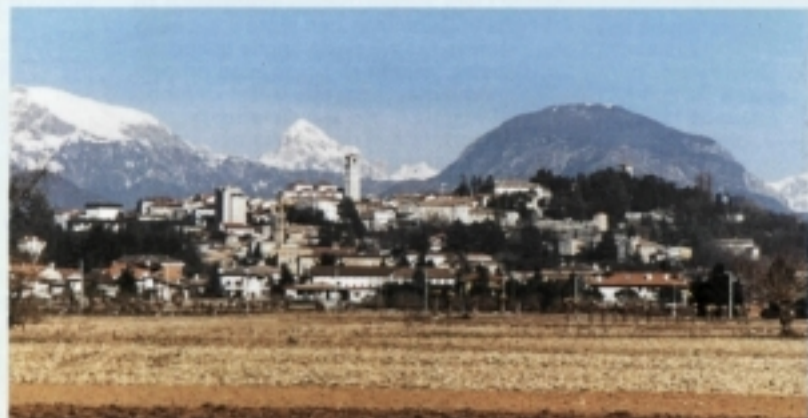
«Nel contempo l'ufficio tecnico e operativo con tutto il personale era stato trasferito a San Daniele del Friuli».

Dal 1970 al 1975 la Comunità ha dato vita e promosso diverse iniziative: istituita la segreteria e gli uffici amministrativi, costituito l'ufficio tecnico e urbanistico con l'organico di 4 geometri e un ingegnere, tecnici che assistevano i Comuni privi di tecnico comunale, dando inizio a progettazioni di opere pubbliche per conto dei Comuni consorziati a costi irrisori. Sono state progettate fognature, depuratori, cimiteri, ambulatori, ponti e strade ed altre opere pubbliche di competenza comunale. È stato affrontato il problema della raccolta e smaltimento dei rifiuti solidi urbani quando Regione e Provincia non avevano considerato il problema urgente in quanto non ancora obbligatorio. È stato progettato e dato inizio alla costruzione del Centro Sociale di Fagnana, su un terreno messo a disposizione dall'E.C.A. di Fagnana, Centro che allora doveva essere destinato a Casa di Riposo per tutta la Comunità.